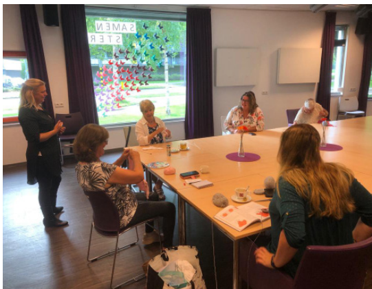
Gesprek met de breiclub wijkgebouw Linquenda