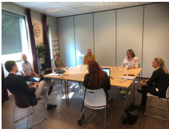
Gesprek met beheerders cluster Zuid

Onderstaand een impressie van het bezoek.