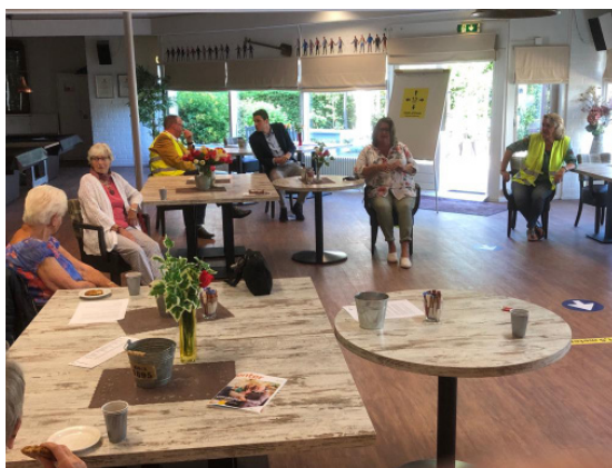
De dames van de spelletjesclub 't Rietland vertellen hun ervaringen