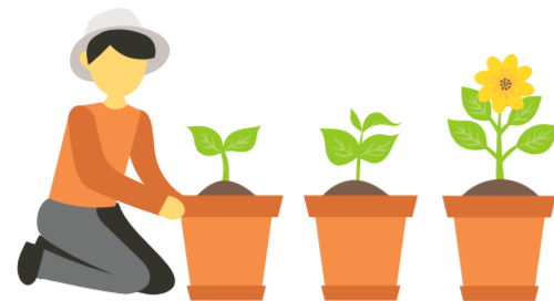
ALLES WAT JE AANDACHT GEEFT GROEIT

Wij informeren je graag over de belangrijkste punten die uit de gesprekken met medewerkers en vrijwilligers naar voren zijn gekomen. We hebben deze uitkomsten gekoppeld aan verschillende fases die we rondom vrijwilligerswerk doorlopen. Een rode lijn uit deze gesprekken was het belang van aandacht. Aandacht voor elkaar. Aandacht voor wat we doen. Aandacht voor bezoekers. Aandacht voor goede en duidelijke werkinstructies en trainingen voor zowel onze medewerkers als vrijwilligers.