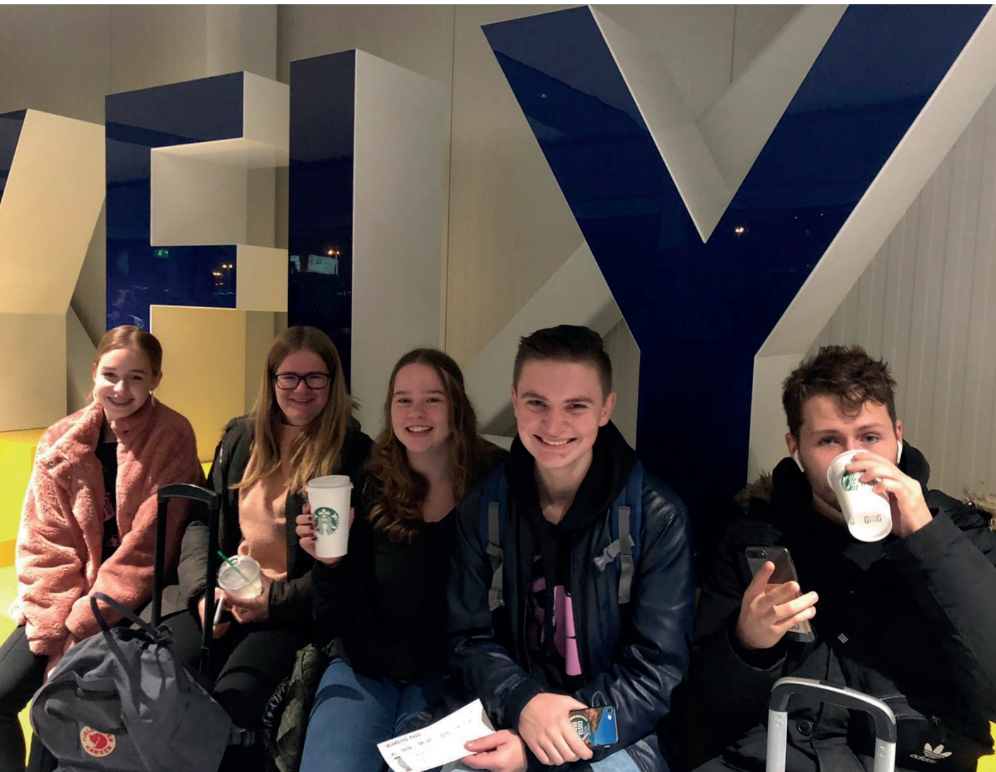
Het Nederlandse groepje klaar voor vertrek

Wat hebben ze zich vastgebeten! en mogen leren dat ondanks dat het niet altijd makkelijk is, daar waar een wil is, is een weg. Met gepaste trots hebben ze dan ook in april 2020 te horen gekregen dat hun uitwisseling met de naam: Push your limits is goedgekeurd! Daarover horen jullie vast later meer.